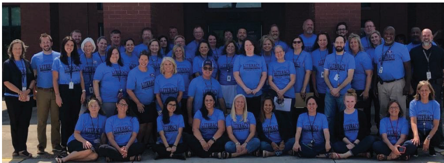
LCCA Faculty and Staff on First Day of 2019-2020 School Year