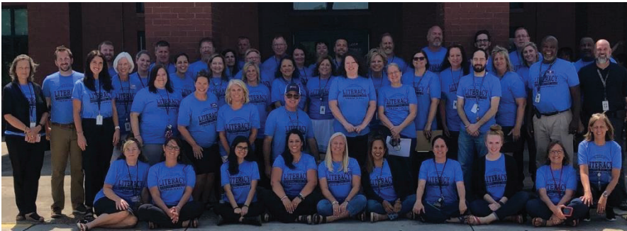
Personal del LCCA en el primer día del año escolar 2019-2020.